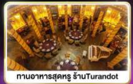
กานอาหารสุดหรู ร้านTurandot