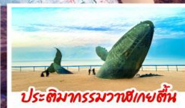
ประติมากรรมวาฬยักษ์ตื่น