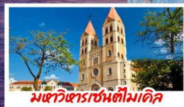
มหาวิหารเซนต์ไมเคิล