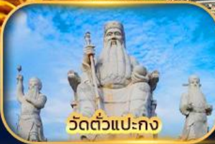
วัดตัวแปะกง