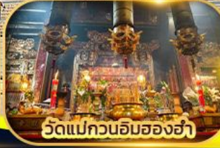
วัดแม่กวนอิมฮ่องฮ่า