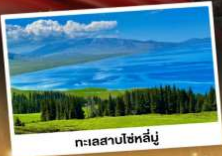
ทะเลสาบไซทลีตู้

ชมวิวดอกคังการแบบยุโรปผสมเอเชีย กุ้งหนุ่ยานาราตี ทะเลสาบสีเทอร์ควอยซ์