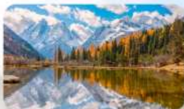
สี่ครุณี