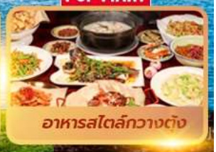
อาหารสไตล์กวางตุ้ง