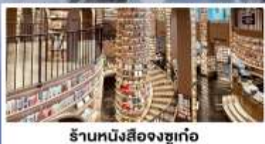
ร้บหน้งส้องซุเก้อ