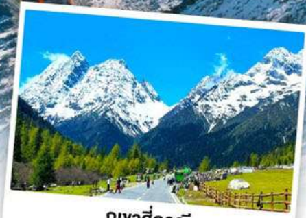
กุเวาสีครุณี

เดินทางโดย: สายการบินเจียงตูแอร์ไลน์ (EU)