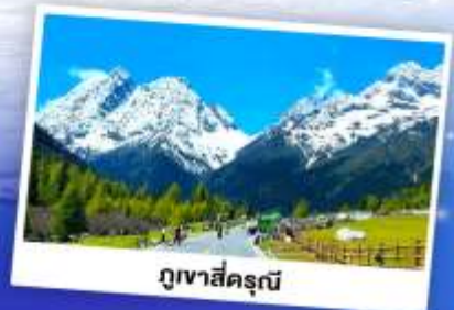
กุเวห้ศ้ครุณ้