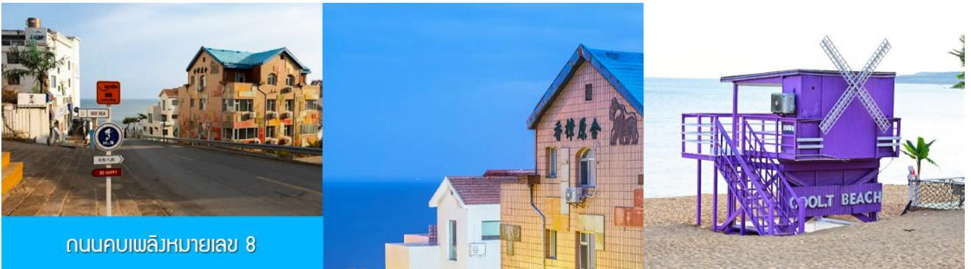
ถนนคอบเพลิงหมายเลข 8

นำท่านชม สวนสาธารณะเวย์ไห่ 威海公园 สวนสาธารณะริมทะเลที่ใหญ่ที่สุดของเมืองเวย์ไห่ ให้ท่านชมและถ่ายภาพคู่กับ กรอบรูปยักษ์วิวทะเล 威海公园大相框 แลนด์มาร์คที่เป็นอีกหนึ่งไฮไลท์ที่สุดฮิตของเวย์ไห่