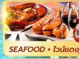
SEAFOOD + ไวน์แดง