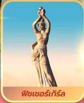
ฟิชเซอร์เกิร์ล