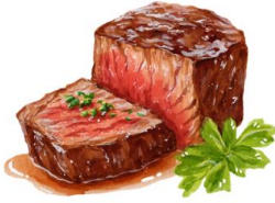
● ไก่ทานเนื้อวัว

ขอความกรุณาแจ้งวัตถุดิบที่ท่านแพ้หรือไม่สามารถรับประทานได้