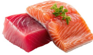
● ไก่ทานปลาดิบ