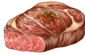
● ไก่ทานเนื้อหมู