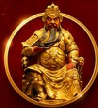
ขอพรเทพเจ้ากวนอู

เปิดดวงเศรษฐี เสริมดวงจ๋วยที่ได้หัววัน ขอพรเทพกวนอู รับพลังบารมีเจ้าแม่มาจู่ 4 วัน 3 คืน