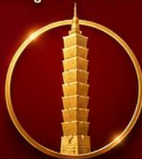
เสริมดวงเศรษฐี