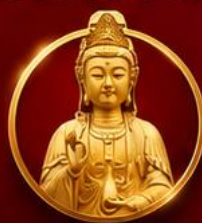
รับพลังบารมีเจ้าแม่มาจู่