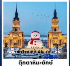
ตึกคาทอลิกซีกซ์