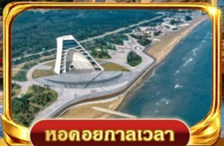
หอดอยกาลเวลา