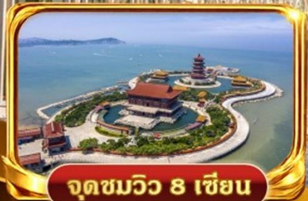
จุดชมวิว 8 เชียง