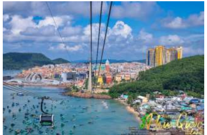
Sun World Hon Thom Nature Park พบกับ

เดียวของเวียดนาม (สำหรับท่านที่สนใจเล่นสวนน้ำ กรุณาเตรียมชุดสำหรับเล่นน้ำ 1 ชุด)