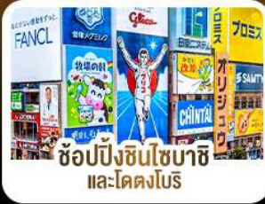
ช้อปปิ้งชินไซบาชิ และโดตงโบริ