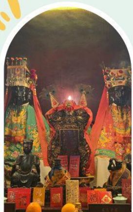
วัดหมิ่นโหมว