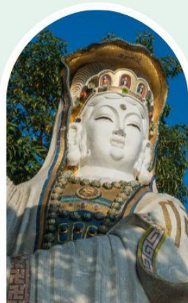
เจ้าแม่กวนอิม ธิพลสัย