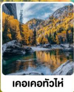
เคอเคอทัวไห่