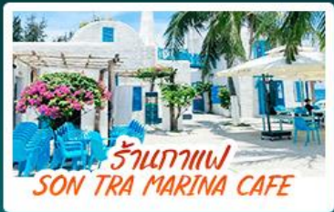
ร้านกาแฟ SON TRA MARINA CAFE