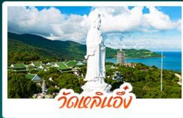
วัดเข็กนึ่ง