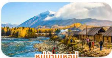
หมู่บ้านเหมอู๋