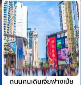
ถนนคนเดินเจียฟางเป็ย