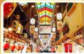
ตลาดปลาฮิชิ