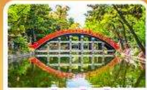
ศาลเจ้าสุมิโยชิ โทเมะ