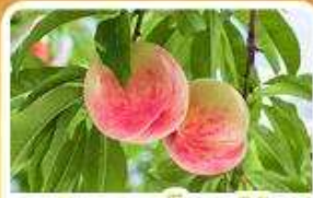
กิจกรรมเก็บผลไม้