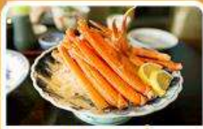
พิเศษ! ชาบู