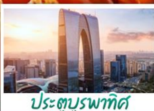
ประตูบูรพาทิศ