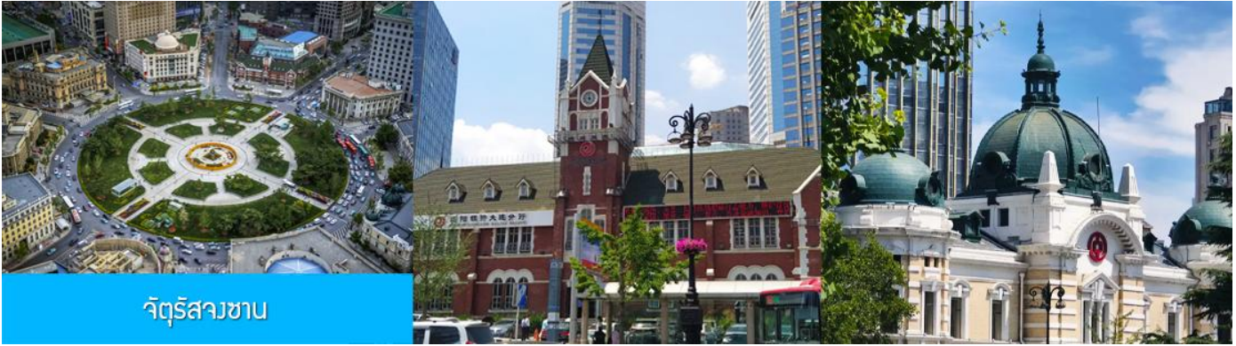
จัตุรัสวงเวียน