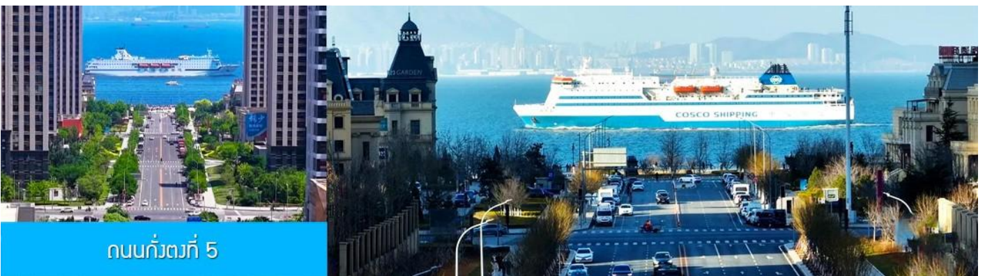
ถนนกว้างที่ 5

จากนั้นนำท่านเที่ยวชม สวนน้ำเมืองเวนิสตะวันออก 大连东方威尼斯城 เป็นเมืองเวนิสจำลองที่ถูกสร้างขึ้นด้วยทุนกว่า 8,000 ล้านดอลลาร์ ออกแบบโดยบริษัท ARC จากประเทศฝรั่งเศส โดยจำลองผังเมืองเวนิสในประเทศอิตาลี บนพื้นที่กว่า 400,000 ตารางเมตร ประกอบด้วยคลองเวนิสและอาคารที่มีสถาปัตยกรรมแบบตะวันตกกว่า 200 หลัง มีบริการล่องเรือคอนโดล่าแก่นักท่องเที่ยว นำท่านเดินชม ถ่ายภาพที่ระลึกท่ามกลาง