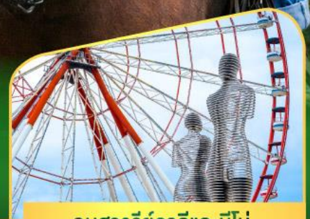
อนุสาวรีย์อาลีและนีโน่