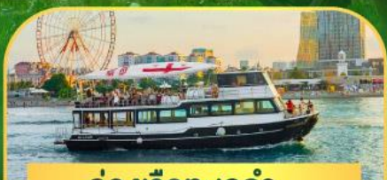
ล่องเรือทะเลดำ