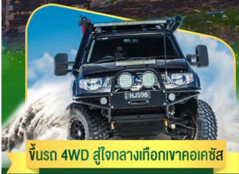
คันรถ 4WD สู้อีกกลางเทือกเขาคอเคซัส