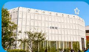
บูรีกินคาหลี