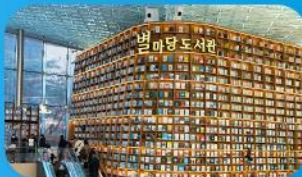
ห้องสมุดสตาร์ฟิลา

เก็บทุกไฮไลท์ ในกรุงโซล ตั้งแต่ความงดงามของ พระราชวังเคียงบ็อก ชมวิวสุดอลังการที่ ดักลียอดเค โยลสกาย (รวมค่าลิฟต์ขึ้นดัก สุกสกมินสี่ที่ สวนสนุกลียอดเค เว็รล (รวมค่าบัตรเครื่องเล่น) เพลิดเพลินไปกับโลกใต้ทะเล ลีตดเค อควาเรียม (รวมค่าบัตรเข้าชม) เช็กอินแลนด์มาร์กสุดฮิตอย่างห้องสมุดสตาร์ฟิลา โกเอกมอลล์ เดินเล่นย่านฮิป บูรีกินคาหลี ของชุง และช้อปปิ้งซัมเมอร์เซล สูดฟีน ย่านเมียงดงและองแด