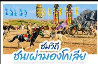
ชมวิถี ชนเผ่ามองโกเลีย

เปิดประสบการณ์ พักแรมมองโกเลียสุดพรีเมียมกลางทุ่งหญ้า สัมผัสบรรยากาศพระอาทิตย์ขึ้นสุดโรแมนติก ชมวิถีชนเผ่ามองโกเลีย พร้อมปาร์ตี้กองไฟใต้ท้องฟ้าเต็มไปด้วยดาว • ตะลุยทะเลทรายอินเคินทาลา ทำรูปสุดปังกลางทะเลทรายสีทอง • เที่ยวครบทั้งทุ่งหญ้าแอร์ดอส วัฒนธรรมมองโกเลีย และเมืองสุดโมเดิร์นในกรีปเดียว แบบสวยหรู ดูแพงทุกวัน