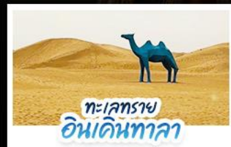
ทะเลทราย อินเคินทาลา