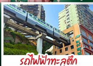
รถไฟฟ้าทะเลสุติก