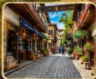
เดินเล่นย่านเมืองเก่า บรรยากาศย้อนยุค