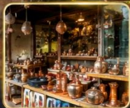
เลือกซื้อของฝาก งานหัตถกรรมพื้นเมือง

สัมผัสเสน่ห์แห่งอดีตในเมืองที่เวลาเดินช้าลง กับสถาปัตยกรรมอันงดงาม วัฒนธรรมที่ยังคงมีชีวิต และความอบอุ่นจากผู้คน