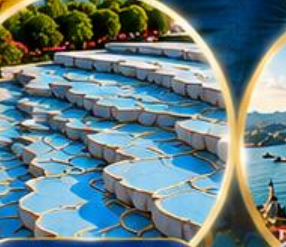
ปานุกคาล์ Pamukkale