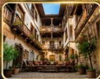
บ้านเรือนสไตล์ออตโตมัน อายุกว่า 200 ปี

เมืองท่องเที่ยวที่มีชื่อเสียงของจังหวัดการาบิก (Karabük) ในปี 1994 เมืองซาฟรานโบลู ได้ถูกองค์การยูเนสโกยกให้เป็น มรดกโลกทางด้านวัฒนธรรม