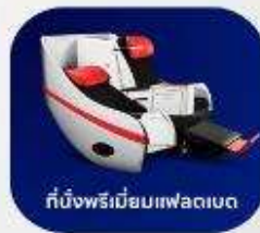
ที่นั่งพรีเมียมแพลนเน็ต