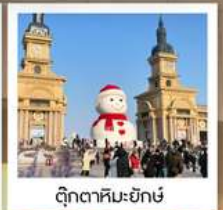
ตึกตาคิยะ-ยักซ์