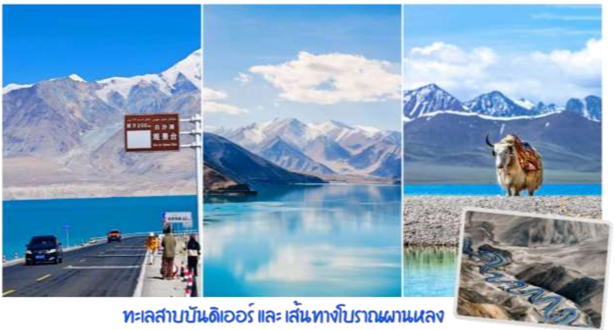
ทะเลสาบบันดิเออร์ และ เส้นทางโบราณผานหลง

นำท่านสู่ ถนนเส้นทางโบราณผานหลง (Panlong Ancient Road) ตั้งอยู่บนที่ราบสูงพามีร์ (Pamir Plateau) เขตเมืองทาชกูร์กัน (Taxkorgan) ทางตอนใต้ของเขตปกครองตนเองซินเจียงอุยกูร์ ประเทศจีน ถนนบนภูเขาที่คดเคี้ยวเลี้ยวลดอันตระการตาในเขตปกครองตนเองทาชกูร์กัน (Taxkorgan) ทางตอนใต้ของซินเจียง ประเทศจีน มีฉายาว่า "ถนนมังกรขด" ขึ้นชื่อเรื่องโค้งหักศอกกว่า 600 โค้ง บนภูเขาสูงชัน เป็นแลนด์มาร์กสำคัญสำหรับสายถ่ายภาพและคนรักการเดินทางที่ต้องการท้าทายฝีมือการขับขี่ ให้ทัศนียภาพที่สวยงามและแปลกตาของแนวภูเขาสูงชันและทะเลทรายในเขตซินเจียง จากนั้นนำท่านเปลี่ยนรถเป็นรถ 7 ที่นั่ง เพื่อเดินทางสู่ทะเลสาบบันดิเออร์ ทะเลสาบบันดิเอร์ (Bandir Blue Lake) หรือ อ่างเก็บน้ำเซียบันดี (Xiabandi Reservoir) เป็นทะเลสาบสีฟ้าครามใสบริสุทธิ์ที่ตั้งอยู่ท่ามกลางเทือกเขาพามีร์ ในเขตปกครองตนเองซินเจียงอุยกูร์ ประเทศจีน ขึ้นชื่อเรื่องวิวธรรมชาติที่สวยงามราวกับภาพวาดและน้ำสีฟ้าเข้มอันเป็นเอกลักษณ์จากการละลายของน้ำแข็ง น้ำสีฟ้าเทอร์ควอยซ์ตัดกับเทือกเขาสีน้ำตาลและท้องฟ้าสีคราม เป็นจุดถ่ายภาพที่ยอดนิยมในเส้นทางชมธรรมชาติบนที่ราบสูงพามีร์