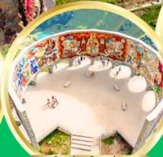
Russian-Georgian Friendship Monument