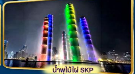
น้ำพุไม้ไผ่ SKP