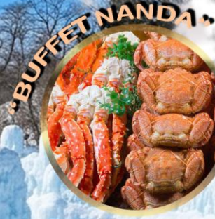
LAKE SHIKOTSU ICE FESTIVAL 2027