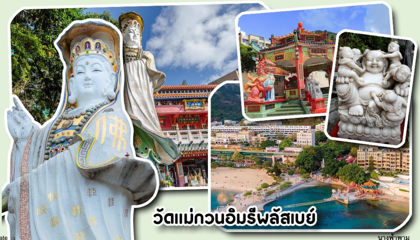
วัดแม่กวนอิมริพลัสเบย์

จากนั้นพาท่านเดินทางไปนมัสการ เจ้าแม่กวนอิมริมหาดริพลัสเบย์ วัดแห่งนี้ถูกสร้างขึ้นเพื่อคุ้มครองชาวประมงเวลาออกเรือไปหาปลาในสมัยก่อน บริเวณวัดมีสิ่งศักดิ์สิทธิ์มากมาย ได้แก่ เจ้าแม่กวนอิม ประดิษฐานอยู่ทางด้านซ้ายของวัด ซึ่งผู้คนนิยมเดินทางไปกราบไหว้ขอพรเรื่องการมีบุตร และยังมีพระสังกัจจายที่เชื่อกันว่าสามารถขอเพศของบุตรที่จะมาเกิดได้ โดยหลังจากกราบไหว้แล้วก็ให้ลูบที่ท้องของพระสังกัจจาย ถ้าอยากได้ลูกชายให้ลูบท้องซ้าย อยากได้ลูกสาวให้ลูบท้องขวา ถัดมาคือ เจ้าแม่ทับทิมเทพีแห่งท้องทะเล ท่านจะคอยคุ้มครองผู้เดินทางทางเรือ หรือผู้ที่เดินทางไปไหนมาไหนท่านจะคอยคุ้มครองให้ปลอดภัย และมีโชคลาภ ถัดจากบริเวณที่กราบไหว้ขอพร ก็จะมีศาลาแปดเหลี่ยมริมน้ำ และสะพานเล็กๆ ที่ชื่อว่าสะพานต่ออายุ ซึ่งเชื่อกันว่าหากเดินข้ามสะพานแห่งนี้ 1 ครั้ง ก็จะมีอายุยืนขึ้น 3 ปี