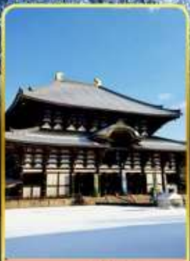
นาราโทไดจิ

พิเศษพักในเมืองคุสัทสึออนเซ็นพร้อมชมยูบาทากะ