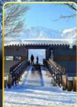
ฮาคุบะอิวาตาคะ