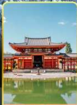
วัดเมียวโดอิน