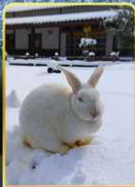
หมู่บ้านกระต่ายคางะ