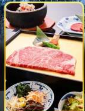
บิ๊งย่าง ROKKASEN

🌊 ออนเซ็น 3 คั้น 🧳 มน.กระเป๋า 1 ใบ 23 กก 🌞 9Days 6Night