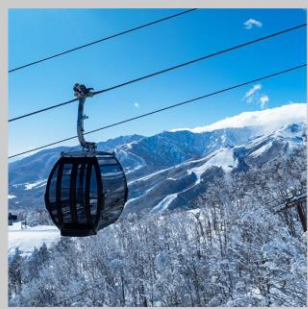
“HAKUBA IWATAKE GONDOLA”