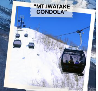
"MT. IWATAKE GONDOLA"