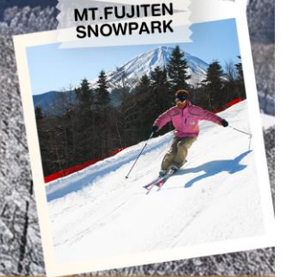
"MT. FUJITEN SNOWPARK"

วันเดินทาง 30 ธ.ค. - 5 ม.ค. 2570 (วันขึ้นปีใหม่)