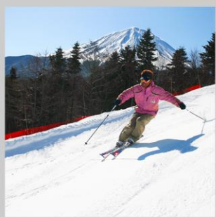
“FUJITEN SNOW PARK”