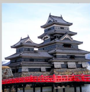
“MATSUMOTO CASTLE PARK”