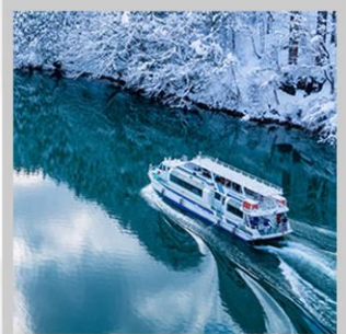
“SHOGAWA YURAN CRUISE”

ตื่นตาตื่นใจกับการประดับไฟหมู่บ้านมรดกโลก “SHIRAKAWAGO LIGHT UP 2027” อยู่ท่ามกลางหุบเขาที่อุดมสมบูรณ์ เปลี่ยนอริยาบท “นั่งกระเช้าฮาคุบะ อิวะตะกะ” เพื่อชมวิวเทือกเขาแอลป์ญี่ปุ่นกับทิวทัศน์ฤดูหนาวแบบพาโนรามา เดินเล่น “โทยามะ คังซุยพาร์ค” สวนสาธารณะริมน้ำ ของเมืองโทยามะ ที่มีฉากหลังเป็นวิวเทือกเขาแอลป์ที่งดงาม สนุกสนานกับการเล่นหิมะ ในกิจกรรมต่างๆ ณ “TAKASU SNOW PARK YUKINOS” เปลี่ยนอริยาบท “ล่องเรือสำราญชมหุบเขาโชนะวะ” ชมวิวสะพานนางาซากิ สีแดงสดที่ตั้งเด่นท่ามกลางหุบเขา สัมผัสความงดงามด้านนอก “ปราสาทมัตสึโมโตะ” ที่ตั้งตระหง่านท่ามกลางฉากหลังของเทือกเขาแอลป์ตอนเหนือ