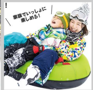
“TAKASU SNOWPARK YUKINOS”