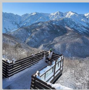
“HAKUBA MOUNTAIN HARBOR”