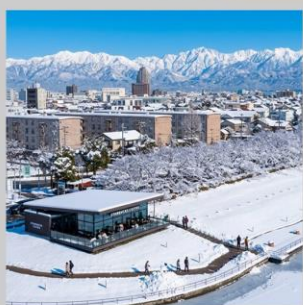
“TOYAMA KANSUI PARK”