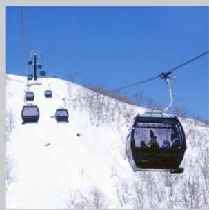
“HAKUBA IWATAKE GONDOLA”