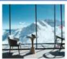
4860 COFFEE SHOP