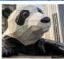
ห้าง IFS หมีแพนด้ายักษ์