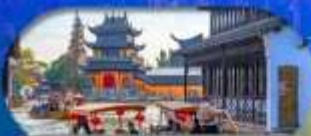
Zhujiajiao Ancient Town ส่องเรือเมืองโบราณ

เซี่ยงไฮ้ ดิสนีย์แลนด์ เมืองโบราณจูเจียเจียว