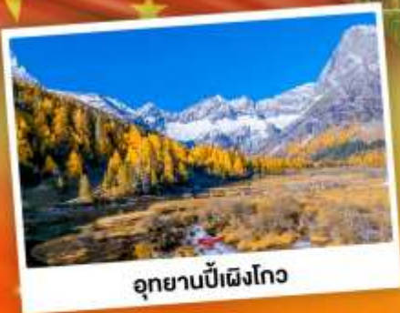
อุทยานปี้ฝิงโกว