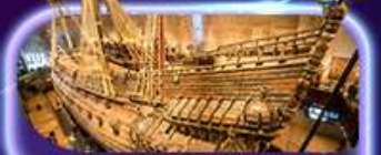
พิพิธภัณฑ์ทว่าซา