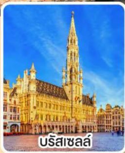
บรัสเซลส์