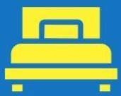
ห้องพักเดี่ยว SINGLE

ตัวอย่างประเภทห้องพัก *เป็นเพียงตัวอย่างเพื่อให้เห็นภาพสำหรับประเภทห้องในแบบต่างๆ