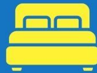
ห้องพักดับเบิล DOUBLE