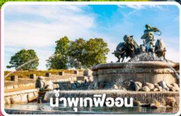
น้ำพุเทพีออน

พิเศษ พิกัดคืนเรือสำราญ DFDS พร้อมมื้ออาหาร Scandinavian Buffet