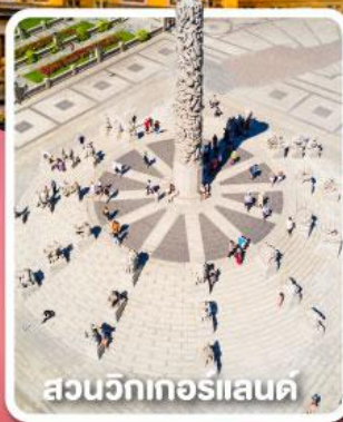
สวนวิกเตอร์แลนด์