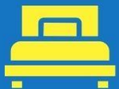
ห้องพักเดี่ยว SINGLE

ตัวอย่างประเภทห้องพัก *เป็นเพียงตัวอย่างเพื่อให้เห็นภาพสำหรับประเภทห้องในแบบต่างๆ