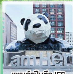
แพนด้าป็นตึก IFS