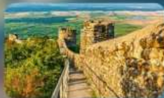
กำแพงเมืองโบราณซิกนากิ