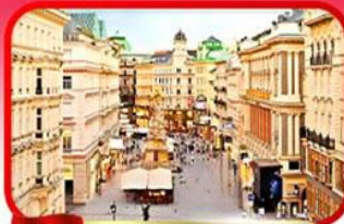
ย่านคาร์กเนออสตรีก