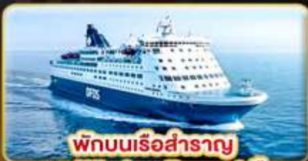
พักผ่อนเรือสำราญ แบบ Window Room 1 คืน