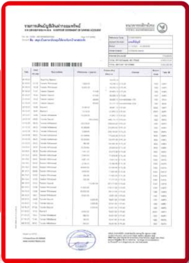
ตัวอย่าง Bank Statement ที่ผู้สมัครต้องยื่นกับธนาคาร

3.4 ปรับสมุดบัญชีธนาคารตัวจริง และเตรียมไปในวันที่ยื่นวีซ่า