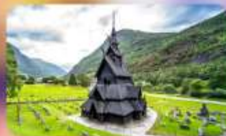
Unseen ไนท์ Borgund/Stave Church