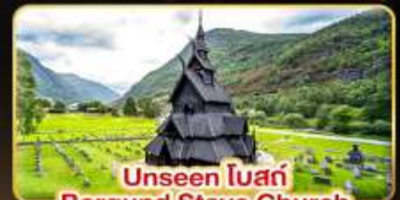
Unseen โบสถ์ Borgund Stave Church