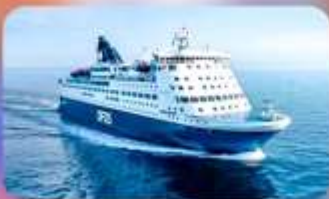
พักบนเรือสำราญ แบบ Window Room 1 คืน

Quality Hotel Hasle Linie หรือเทียบเท่า Scandic Voss หรือเทียบเท่า Grand Hotel Terminus หรือเทียบเท่า Dr. Holms Hotel หรือเทียบเท่า Go Nordic Cruiseline หรือเทียบเท่า Scandic Sydhavnen หรือเทียบเท่า