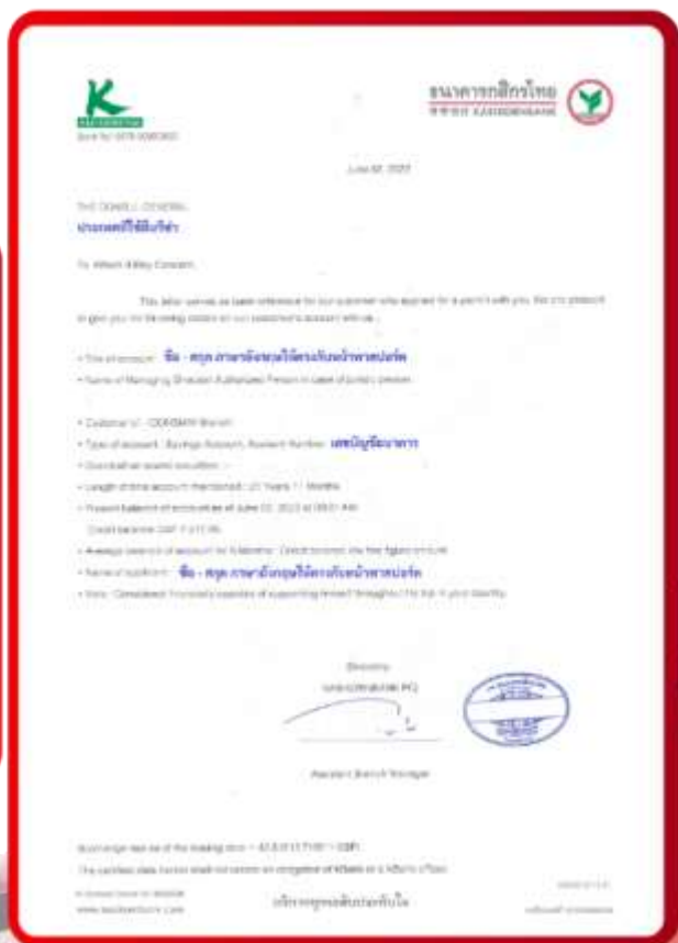
ตัวอย่าง Bank Guarantee ที่ผู้สมัครต้องยื่นกับธนาคาร