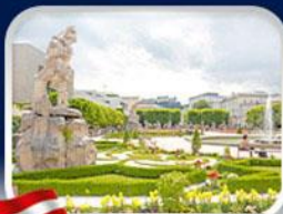
สวนมิราเบิล ซาลซ์บูร์ก